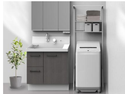
左から、「穴なし槽シリーズ」全自動洗濯機<ES-SV8L-W（ホワイト系）>、設置イメージ

新製品は、本体幅を当社従来機より35mmスリム化し、幅520mm（※1）に設計。ふたを折りたたんだ状態で開いているときの高さは、当社従来機より121mm低い1,113mm（※1）に抑えました。限られたスペースでも設置しやすく、洗濯機上部の空間をより有効に活用できます。