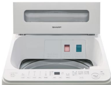
自動投入タンクの「透明窓」

<ES-SV8L/SV7L>に「液体洗剤・柔軟剤自動投入」機能を搭載しました。投入経路が詰まりにくいウォータerpump方式を採用しているため、6カ月に1回程度のお手入れ(※3)で使用可能です。自動投入タンクの前面には、新たに「透明窓」を設けることで、タンクを開けずに、洗剤の残量が一目でわかります。