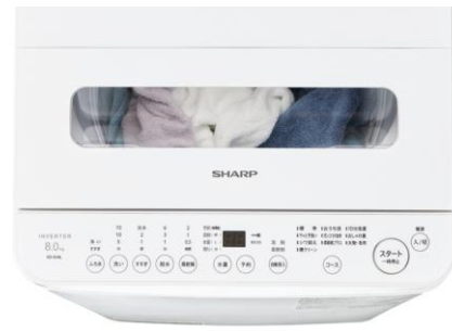
ふたの「透明窓」(イメージ)